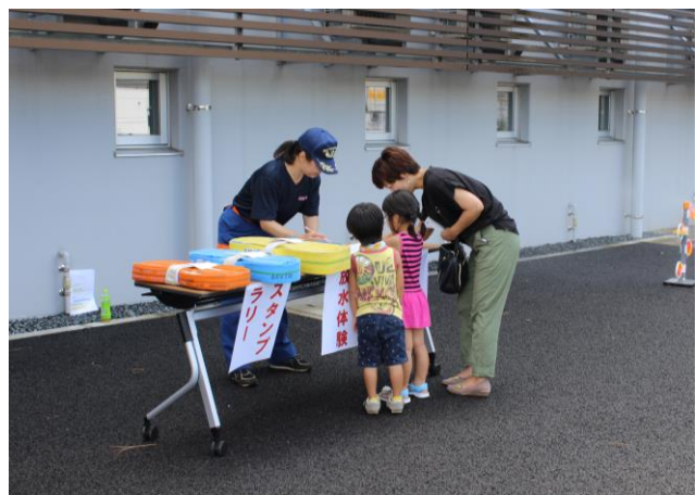
消防クイズ・スタンプラリー