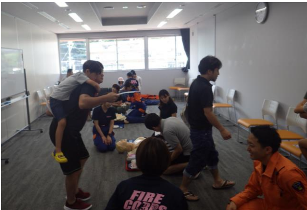
心肺蘇生法・AED体験