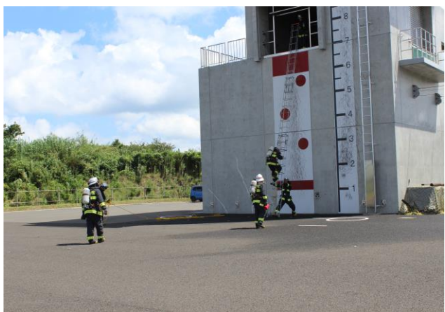
火災救助シミュレーション展示